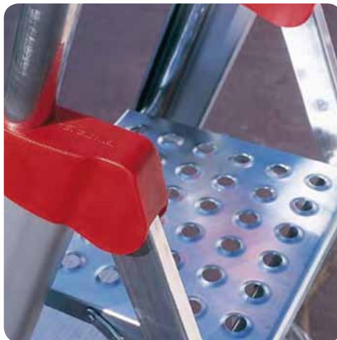
Podest antypoślizgowy 27x27 cm i ergonomiczny pałak aluminiowy. Professional anti-slip platform 27x27 cm and ergonomic upright silvery aluminium.

Lotnicza metoda montażu stopni, bez spawania. Aeronautical-style rung mounting.