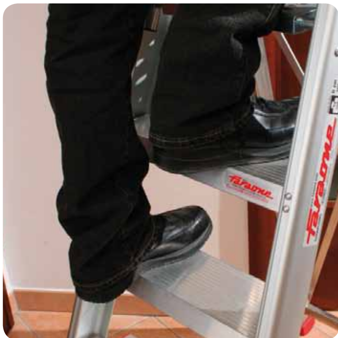
Wygoda i bezpieczeństwo dzięki szerokim stopniom. Special rungs for a safe and comfortable climbing.