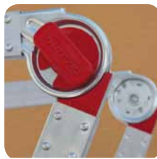
Regulowany zawias. Configurable hinge.