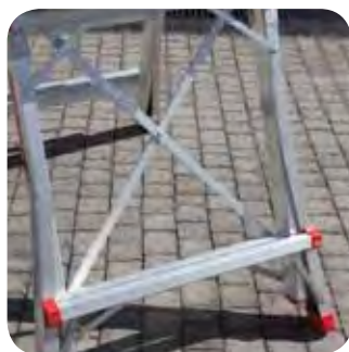
Stabilizatory krzyżowe. Stabilizing cross brace.

Kompaktowa, lekka i łatwo się składa. Compact, light and easy to close.