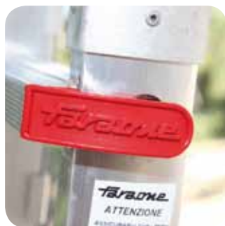
Ergonomiczny uchwyt. Ergonomic handle.